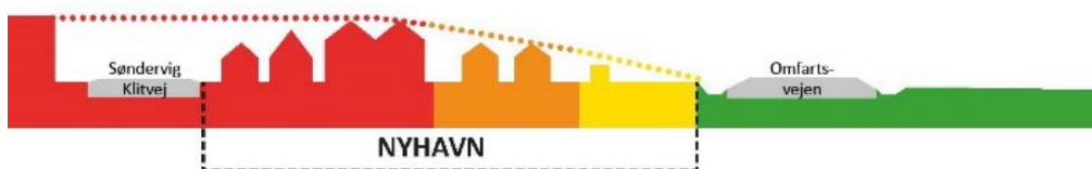
Illustration af bebyggelsens omfang og placering

Området er i dag udlagt til landbrug og har ingen rekreativ værdi.