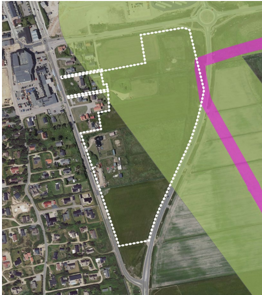
Kabler til Vesterhav Syd øst for lokalplanområde.

Kablerne der skal føre strøm fra vindmølleparken Vesterhav Syd passerer ind over omfartsvejen og lokalplanområdets østligste del, som med lokalplanen udlægges som arealer, der skal friholdes for bebyggelse og anlæg.